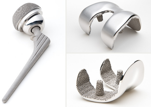
電子ビーム積層造形法により摺動部に必要な緻密部と骨親和性の高いポーラス部を一体成形した人工関節

高度な医療技術を確認するためには、生体材料としての高機能金属材料の研究開発が必要不可欠です。当研究室では、鍛造加工や圧延加工などの塑性加工技術や熱処理から最先端の3次元積層造形技術まで、様々な金属加工プロセスを駆使した医用金属材料